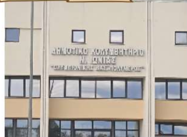
Το Δημοτικό Κολυμβητήριο Νέας Ιωνίας " Ολυμπιονίκης Βασίλης Πολύμερος"