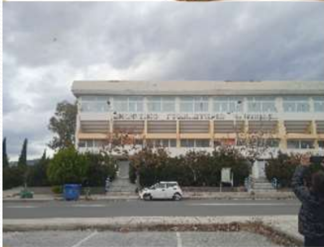
Το Δημοτικό Γυμναστήριο της Νέας Ιωνίας